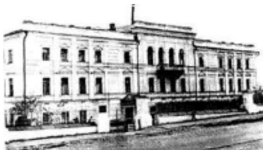
Здание губернской земской управы (военный госпиталь)

Земская управа вырабатывала документы, на основе которых работали библиотеки. В 1902 году разработаны «Правила для бесплатных народных библиотек» 7 . В них определен определенный принцип – бесплатное обслуживание не только жителей села, но и близлежащих к библиотеке сел. Определены часы работы и дни отдыха: 2 дня Пасха, Страстная неделя и 1 выходной день недели, определенный училищным советом. Читателям на дом выдавалась только одна книга на две недели без залога. Согласно правилам, имелась Книга пожеланий читателей по формированию книжного фонда и по имеющимся неудобствам. Заведующий библиотекой доводил записанные туда сведения до губернской управы. Обязанности библиотекаря: выдача книг, консультации по чтению, соблюдена порядка в помещении, ведение документации и составление отчетов. Правила подписаны