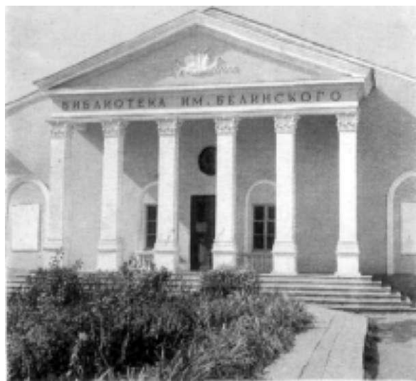
Районная библиотека им. В.Г. Белинского. Заложена в 1948 году

ния, приходилось самой ездить на лесную делянку. Спустя 55 лет, когда праздновался 100-летний юбилей библиотеки, ее спросил ведущий программы праздника, что ей более всего запомнилось за долгие годы работы. «Холод, – был ему ответ. – Холодно было летом и зимой, пока не перешли в другое, отреставрированное здание». За послевоенные годы единственным помещением, отвечающим запросам работников и читателей было новое здание Белинской районной библиотеки. В пятидесятых годах многие районные учреждения переселились в более скромные новые или отреставрированные здания.