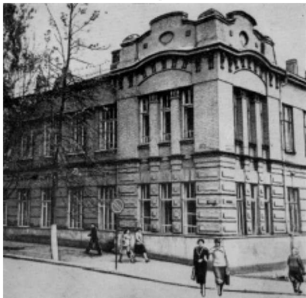
Областная библиотека им. М.Ю. Лермонтова

жи к библиотечной профессии. Так продолжалось до 60-х годов, когда открылось училище культуры и искусства, при областном управлении культуры – курсы подготовки и переподготовки работников культуры. Без преувеличения можно сказать, что все работники библиотек области в двадцатые - пятидесятые годы получили первые профессиональные знания в библиотеке им. М.Ю. Лермонтова.