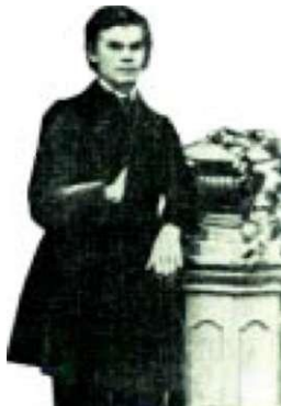
Н.П. Петерсон. 1862 г.

кой губернии собранию книг серьезного содержания грозит немедленное уничтожение», писал он в рапорте в 1869 году