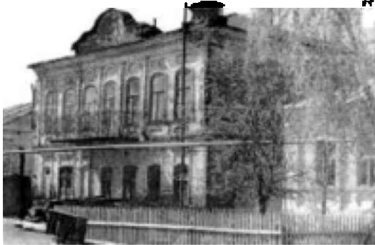
Библиотека-читальня им. великой княгини Елизаветы Федоровны

Комната для выдачи книг занимала 10,5 кв.м., читальня – 20 кв.м, 3 комнаты отданы квартиру библиотекаря. В библиотеке висели иконы, портреты императора Николая II, Елизаветы Федоровны в чер-